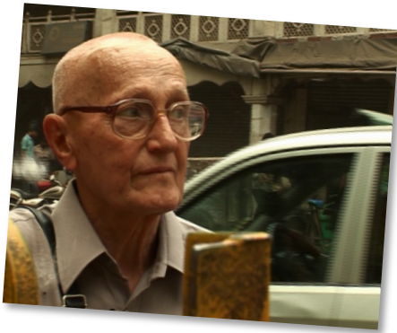
Still from Road Less Travelled

Joining the ONLINERPOL team as a senior postdoctoral fellow, I am extremely excited about my new project on the creative digital practices of hijabi fashionistas and female comediennees of Indian Muslim Diaspora in Europe. It is great to be part of the LMU ethnology department and I look forward to what promises to an intellectually challenging and enriching time ahead!